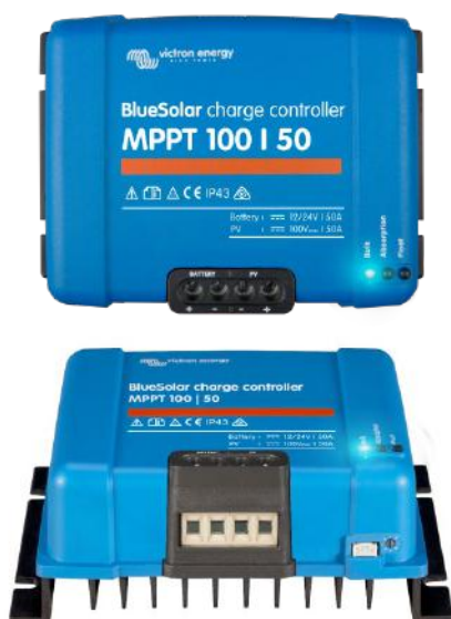
Solar Lade-Regler MPPT 100/50