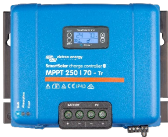
SmartSolar-Laderegler MPPT 250/70-Tr mit optionalem einsteckbarem Display