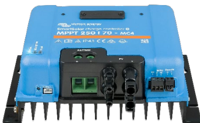
SmartSolar-Laderegler MPPT 250/70-MC4 ohne Display