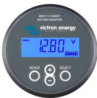
Bluetooth-Erkennung: BMV-712 Smart Battery Monitor