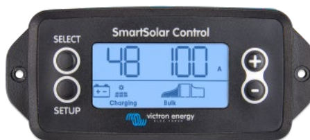
Einsteckbares SmartSolar display

Entfernen Sie einfach die Gummidichtung, die den Stecker an der Vorderseite des Reglers schützt und stecken Sie das Display ein.